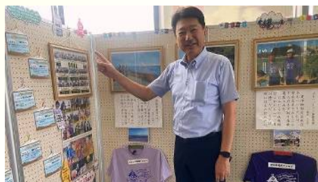
へきなん自転車散歩写真展を開催 〔8月8日〕