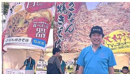
元気ッス！へきなんに参加 〔8月2日〕