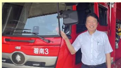
碧南消防署で子ども体験講座を開催 〔7月31日〕