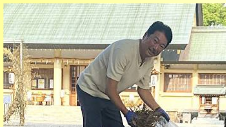
中山神明社の清掃活動に参加 〔7月6日〕