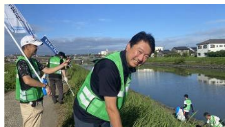
県主催の油ヶ淵浄化デーに参加 〔7月20日〕