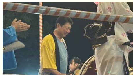
中山地区夏まつりに参加 〔8月3日〕