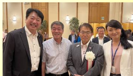
大村知事 西三河県政報告会に出席 〔9月16日〕