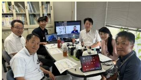
西三河南グループ会議を開催 〔7月16日〕