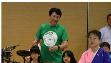
碧南きつなあくを企画・運営 〔9月14日〕