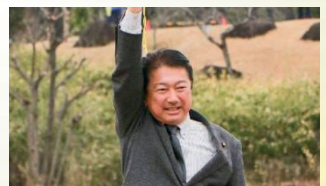
へきなんキッズクロカんに来賓参加 〔2月18日〕