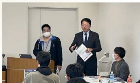
アイシン辰栄労組の研修会で市政報告 〔1月27日〕