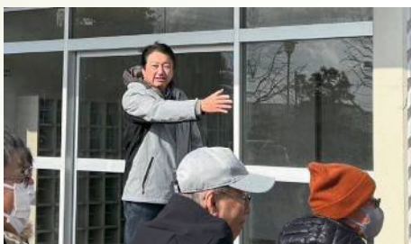
中央小学校で避難所開設訓練を運営 〔3月9日〕