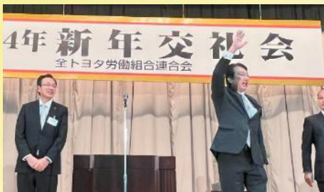
全トヨタ労連の新年交礼会で挨拶 〔1月8日〕