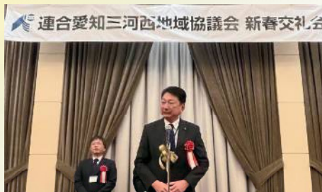
三河西地協の新春交礼会で挨拶 〔1月16日〕