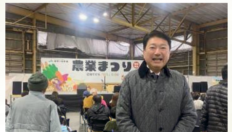
JA あいち中央の農業まつりに参加 〔1月21日〕