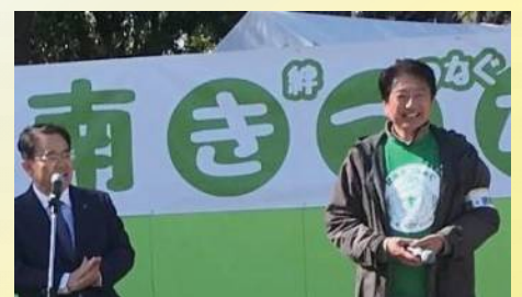
第1回碧南きつなあくを企画・開催 〔3月10日〕