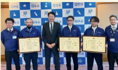
文部科学大臣賞受賞者の表敬訪問 〔1月23日〕