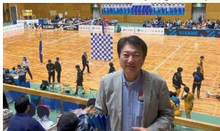
アイシンティルマーレのホームゲーム観戦 〔3月9日〕