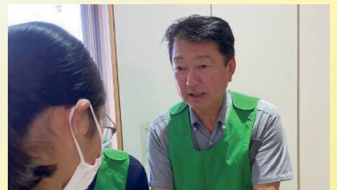
災害ボランティアコーディネーター養成講座に参加 〔9月23日〕