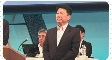
【全トヨタ労連 第52回定期大会】

市民の皆さまとの対話を大切に、『住んで良かったと実感できる街 碧南』そして『次世代に引き継ぐことができる街 碧南』を目指して取り組みます。