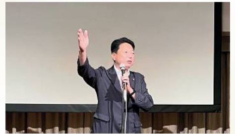
自動車総連組織内議員研修会で挨拶 〔7月7日〕