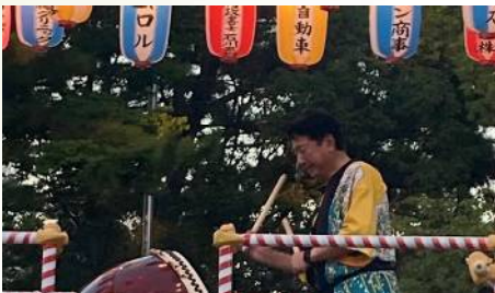
中山地区夏まつりに参加 〔8月5日〕