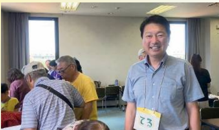
衣浦衛生組合でSDGs 勉強会を開催 〔7月16日〕