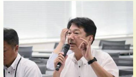
オールアイシン政策制度フォーラムに参加 〔8月1日〕