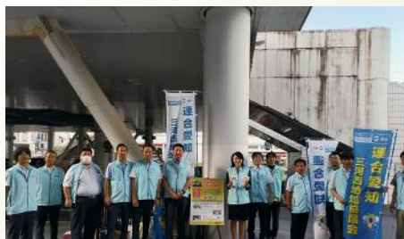
連合愛知三河西地協の街頭活動に参加 〔9月5日〕