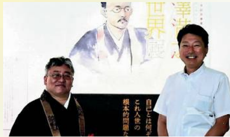
藤井達吉現代美術館内覧会に出席 〔7月6日〕