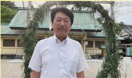
中山神明社夏越大祓式に参列 〔6月25日〕