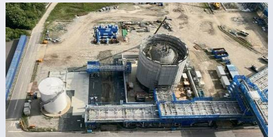
【アンモニアタンクを造成中（2023/8/18撮影）】

今回の4号機実証試験を受け、5号機において50%以上のアンモニア高混焼試験を実施し、電力の安定供給と脱炭素の両立を目指します。