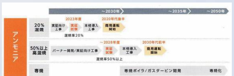
【2050年カーボンニュートラルの実現に向けたロードマップ（出典：JERA）】