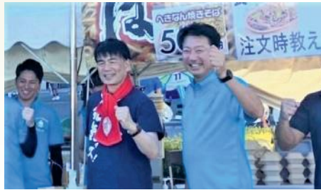
元気ッス！へきなんに参加 〔7月29日〕