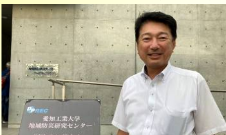
愛工大地域防災センターを視察