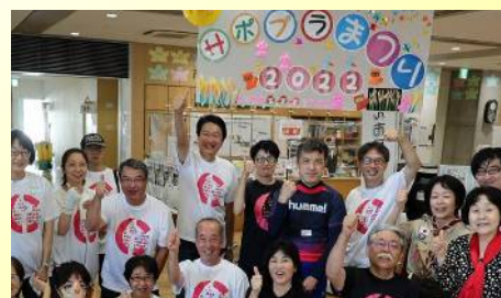
市と共催したサボラまつりを運営