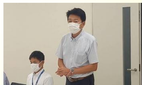
アイシン辰栄労組評議員会で市政報告