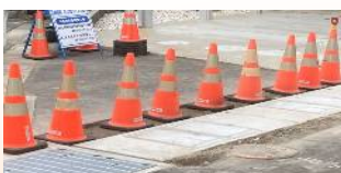
冠水対策で側溝改修（幸町）