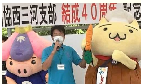
労福協西三河支部記念イベントに参加