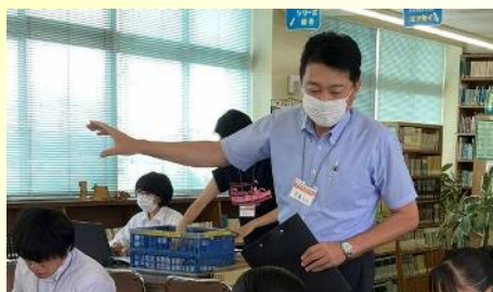
碧南工科高校 FMB プロジェクトを運営