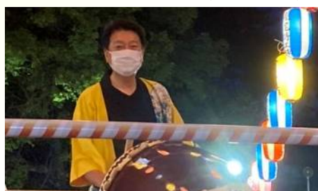
中山地区が主催する夏まつりに参加