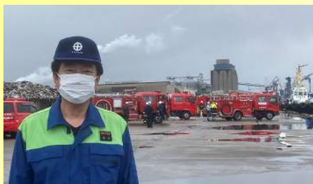
衣浦港消防防災訓練に参加