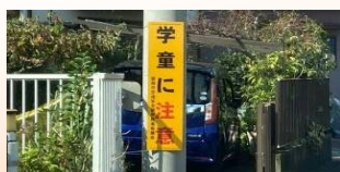
注意喚起看板設置（上町）