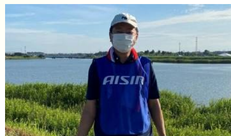
県が主催する油ヶ淵浄化デーに参加