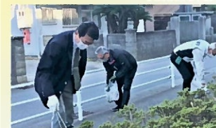
サボラのアダプトプログラムに参加 〔11月4日〕