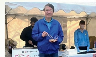
明石公園フェスティバルに参加 〔11月7日〕