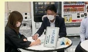
アイシン展室にてくらしの相談を開催 〔10月20日〕