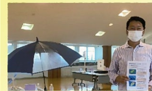
碧南市創意工夫展を視察 〔9月25日〕