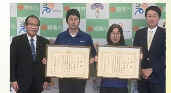
文部科学大臣賞受賞者が表敬訪問 〔11月11日〕