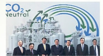
嶋口Gでカーボンニュートラルを勉強 〔11月3日〕