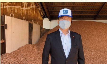
三州瓦のシャモット工場を視察