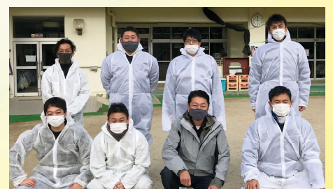
アイシン辰栄労組地域貢献活動を激励