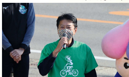
へきなん自転車散歩を企画・運営