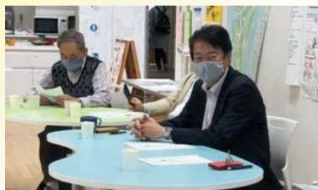
心のトレーニング講座を受講