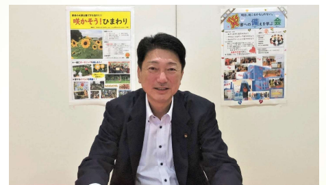
労働組合研修会にリモートで参加