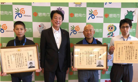
文部科学大臣賞受賞者の表敬訪問