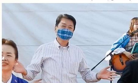
明石公園フェスティバルに参加