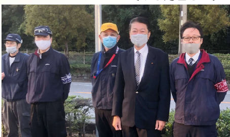
アイシン衣浦工場の挨拶活動に参加