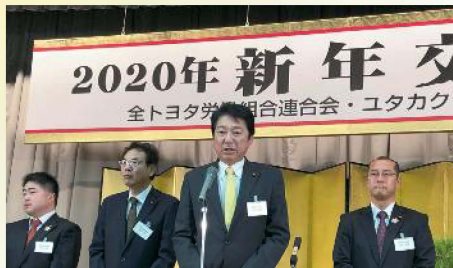
全トヨタ労働組合連合会・ユタカク 2020年新年交 〔1月7日〕