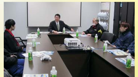
労働組合の地域生活懇談会に出席 〔2月25日〕