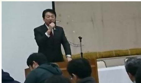
労働組合研修会で活動報告を実施 〔1月24日〕