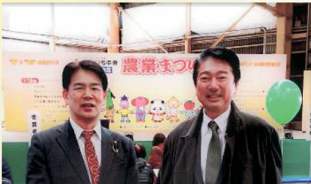
JA あいち中央の農業まつりに参加 〔1月18日〕