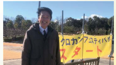
へきなんキッズクロカンで来賓出席 〔2月9日〕