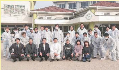
アイシン辰栄労働組合地域貢献活動 〔12月21日〕