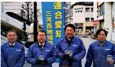
連合愛知三河西地協の街頭活動参加 〔2月12日〕