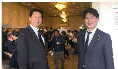
商工会議所主催のへきなん食フェア 〔2月23日〕