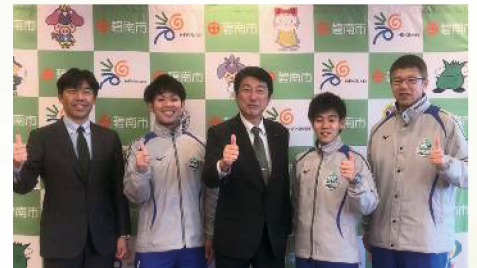
アイシンバレー部と市長表敬訪問 〔1月10日〕